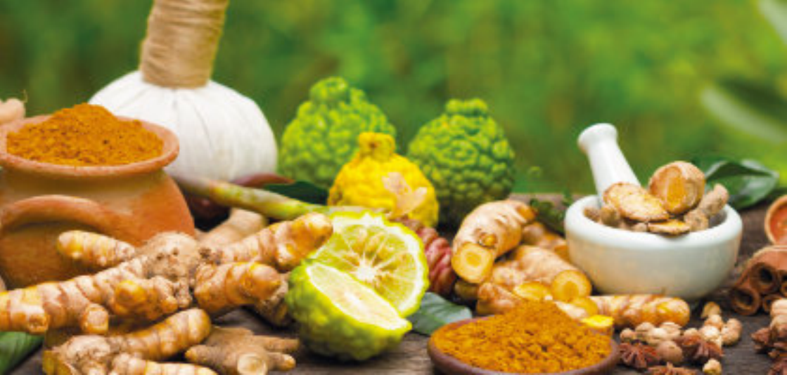
Pinda Sweda Kräuterstempel-Massage