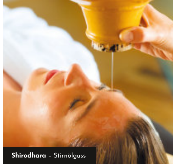
Shirodhara - Stirnölguss